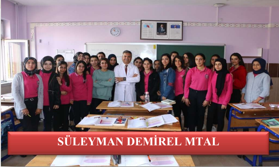
SÜLEYMAN DEMİREL MİTAL