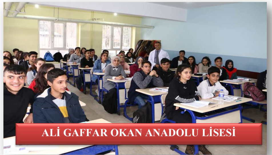
ALİ GAFFAR OKAN ANADOLU LİSESİ