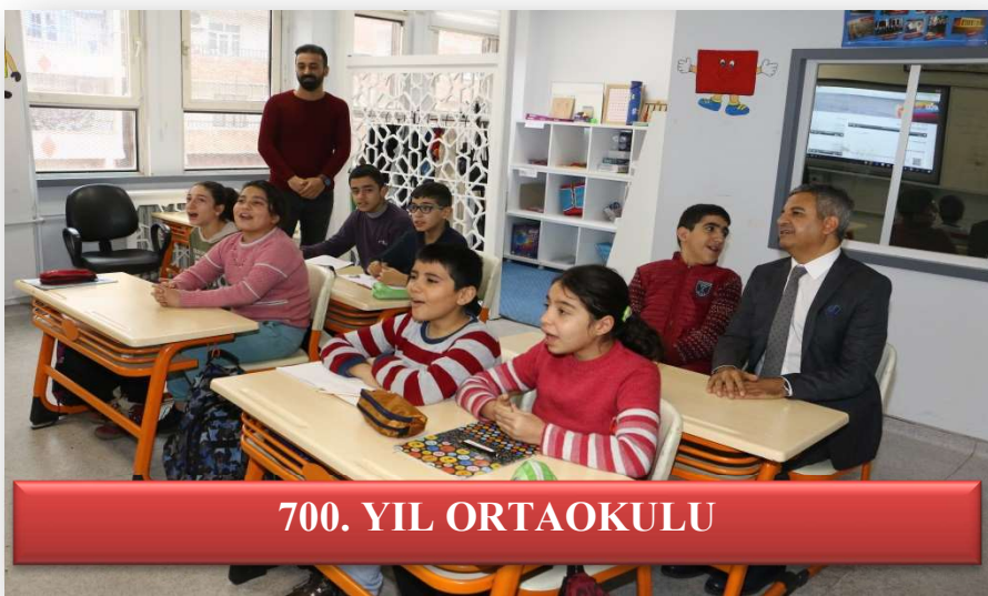
700. YIL ORTAOKULU