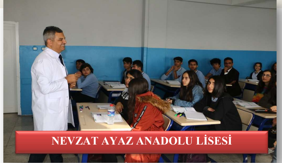
NEVZAT AYAZ ANADOLU LİSESİ