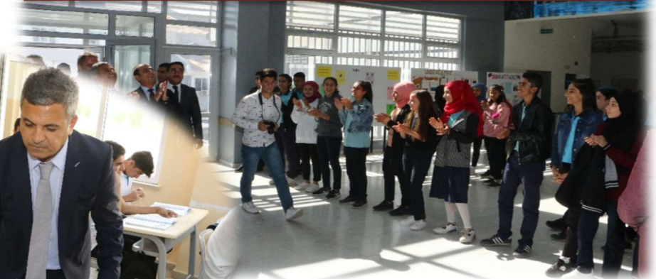
ADNAN MENDERES ANADOLU LİSESİ