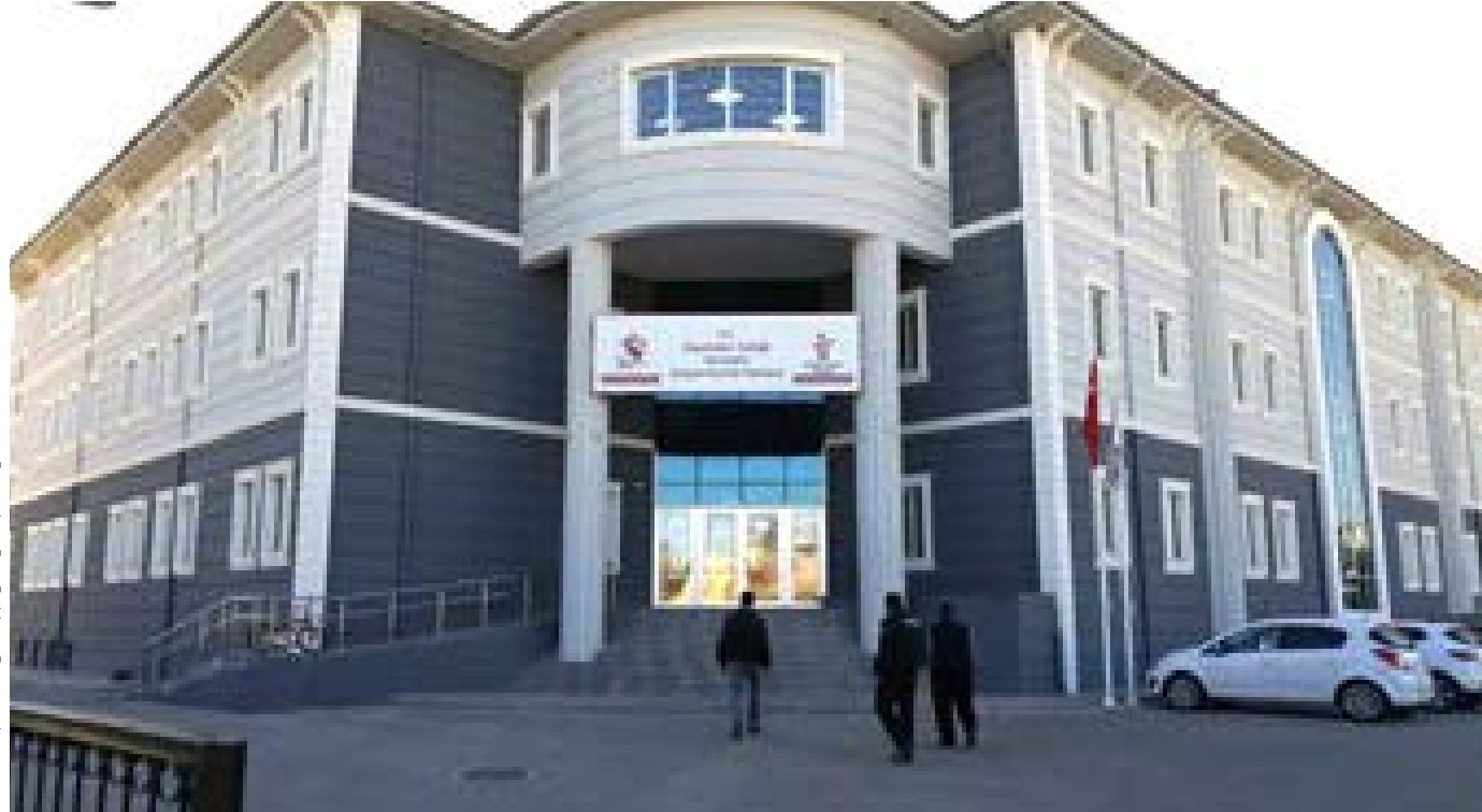
Diyarbakir Aile, Çalışma Ve Sosyal Hizmetler İl Müdürlüğü