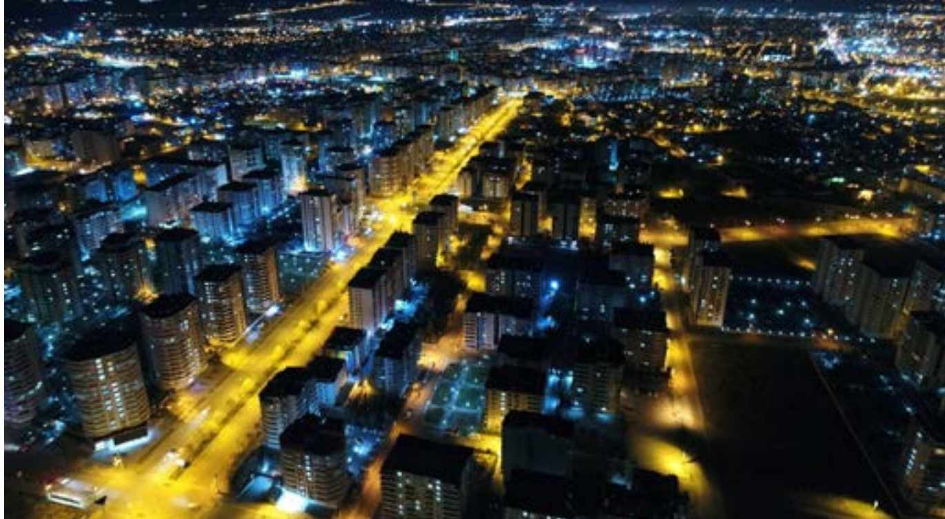
Diyarbakır'dan Bir Görünüm