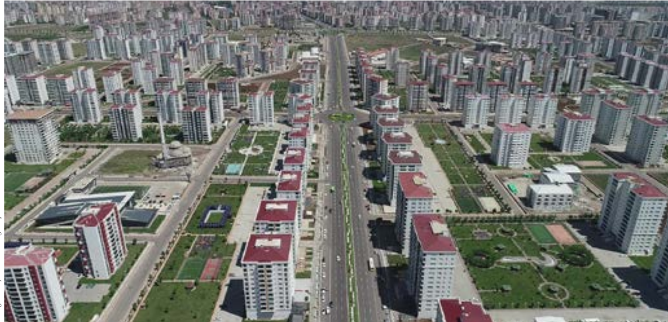
Diyarbakır'dan Bir Görünüm