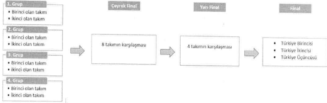
Tablo 3. Her bir kategori için yarışmanın şematik gösterimi